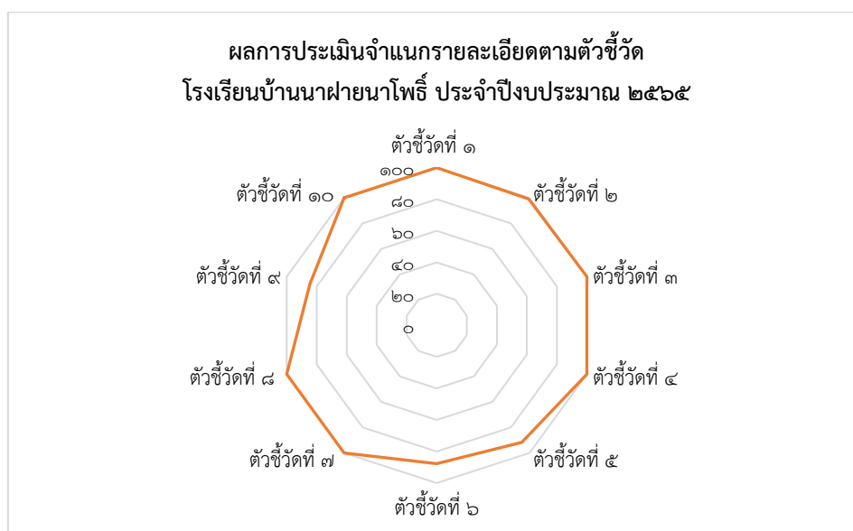
แผนภาพที่ ๒ ผลการประเมินจำแนกรายละเอียดตามตัวชี้วัด